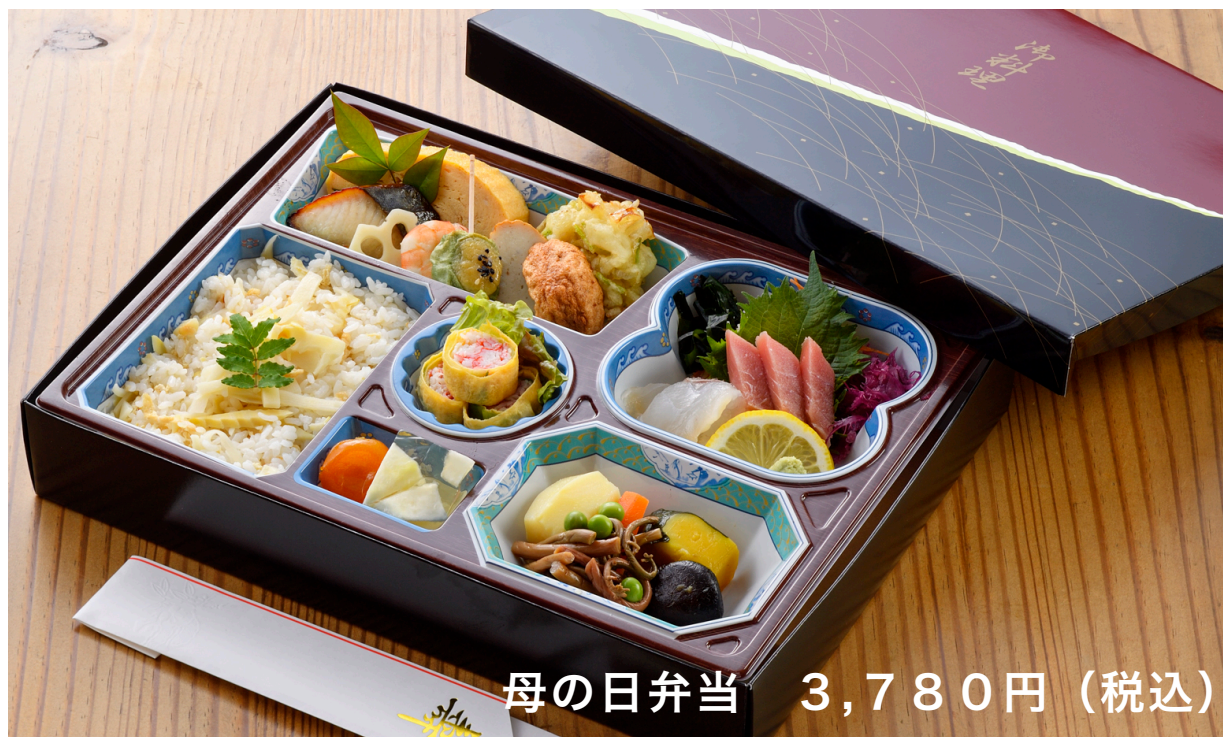
母の日弁当 3,780円(税込)

大切なお母様へ....日頃の感謝の気持ちをこめて、贈り物に、一家団欒のお食事に杉の子が材料を吟味し丁寧な手仕事で仕上げました。